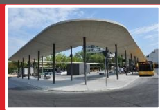
1978 Gründung Tiefbau Ingenieurbau