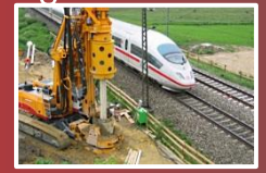
1997 Gründung Spezialtiefbau