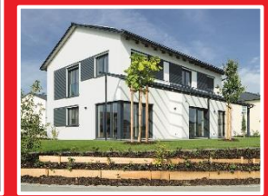
2018 Eröffnung Musterhaus