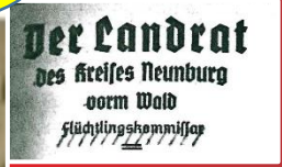
1946 Wiedereröffnung nach 8 Jahren Kriegspause