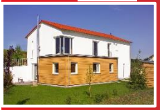
1976 Gründung SF Abteilung