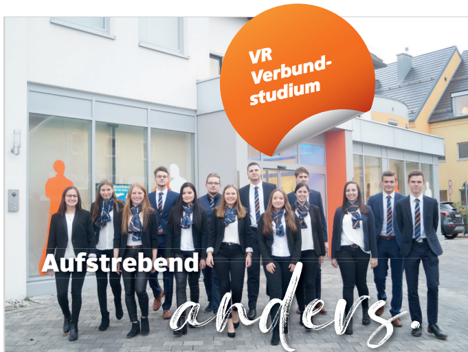
Auszubildende und VR Verbundstudenten der VR Bank Mittlere Oberpfalz eG